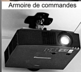
Équipement vidéo projection en mode cinéma de la grande salle de Gentiana